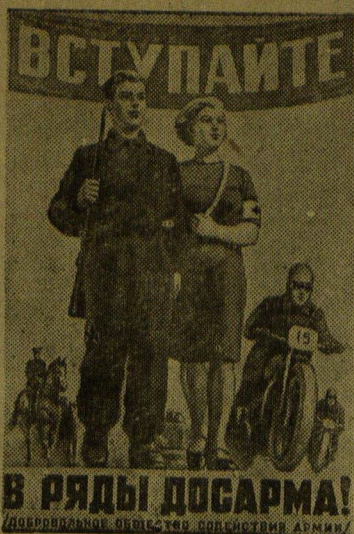
Плакат работы художника Елагина, выпущенный издательством «Искусство».